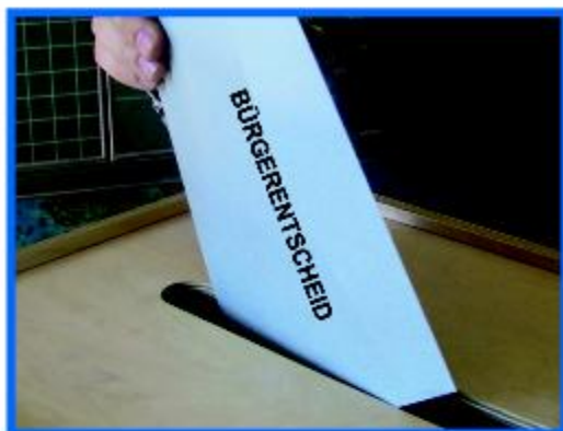
An der Wahlurne soll entschieden werden, ob die Wasbeker der Ausweisung von Windparkflächen zustimmen - oder nicht!

Erwartungsgemäß wurde der Widerspruch von der zuständigen Kommu-