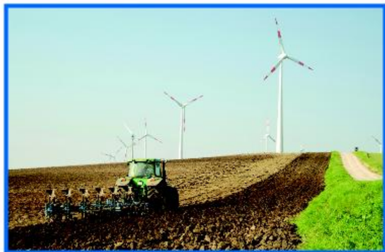
Die für den Wasbeker Bürgerwindpark in Frage kommenden Flächen werden heute intensiv landwirtschaftlich genutzt.

· Infraschall mit einer Frequenz unterhalb 30 Hz verursacht keine Gesundheitsschäden , das beweist eine ausführliche Studie des Bundesgesundheitsamtes. Erst bei einem dauerhaften Schalldruckpegel von über 130 dB tritt eine Gesundheitsgefährdung auf. Messungen an Windturbinen zeigen, dass diese Werte bei weitem nicht erreicht werden und unter Einhaltung der gesetzlich vorgeschriebenen Abstände kaum noch messbar sind.